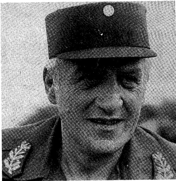
Leopoldo Fortunato Galtieri.