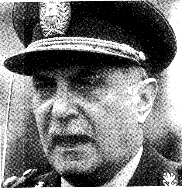
Roberto Eduardo Viola.

Si la respuesta está dada por los hechos, parece que en el Consejo Supremo algo no funciona, lo que ya de por sí es bastante grave, pero mucho más