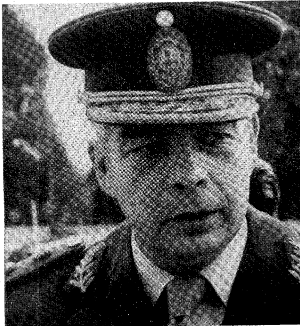
Luciano Benjamín Menéndez.